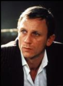
LONDRES, 1997: Daniel Craig