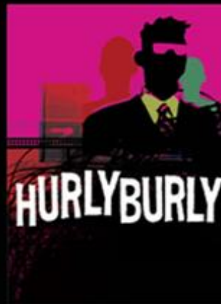
1998: La Película Sean Penn, Kevin Spacey Chazz Palminteri, Meg Ryan Anna Paquin, Robin Wright