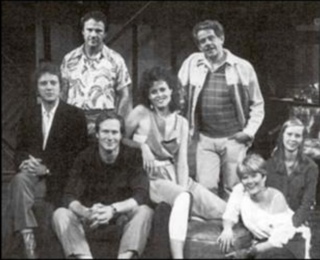
CHICAGO, 1984: William Hurt, Harvey Keitel, Christopher Walken, Sigourney Weaver...