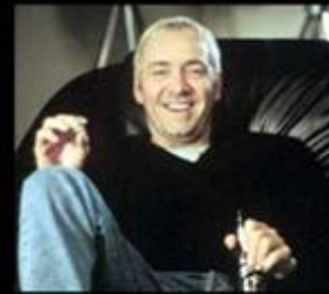
1998: Kevin Spacey