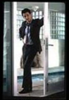
LOS ANGELES 1988: Sean Penn