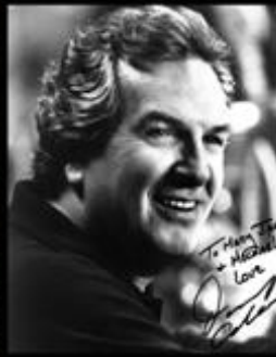
LOS ANGELES, 1988: Danny Aiello